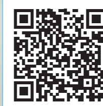
Відэасюжэт пра Быхаўскіх саламяных павукоў