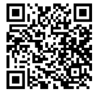
Мал. 1. QR-код для прагляду фрагмента мастацкага фільма «Гамлет» (рэж. Р. М. Козінцаў, 1964)

Францішак Багушэвіч, як вядома, меў некалькі літаратурных псеўданімаў. <...> Самы вядомы з іх — Мацей Бурачок. Пад гэтым псеўданімам Ф. Багушэвіч выдаў у 1891 годзе ў Кракаве «Дудку беларускую», а таксама падрыхтаваў да друку зборнік «Беларускія апавяданні Бурачка» (1899). Як вядома, «Дудка