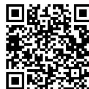
Мал. 3. QR-код для прагляду ўзораў бібліяграфічнага апісання крыніц