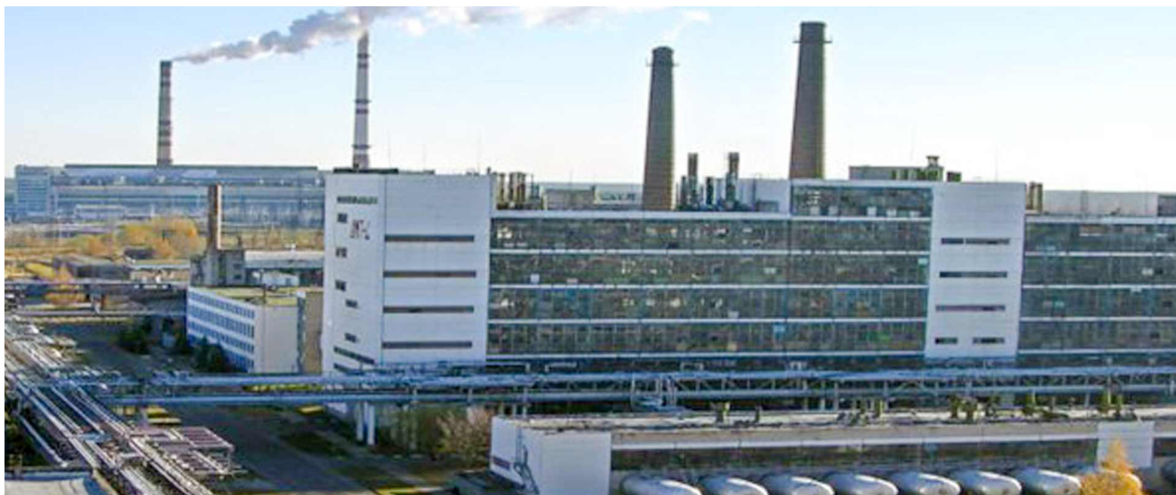
Мал. 7. Адкрытае акцыянернае таварыства «Магілёўхімвалакно»