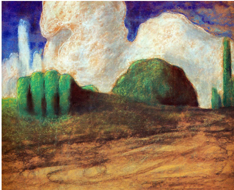
Мал. 9. М. К. Чурлёніс. «Дзень»