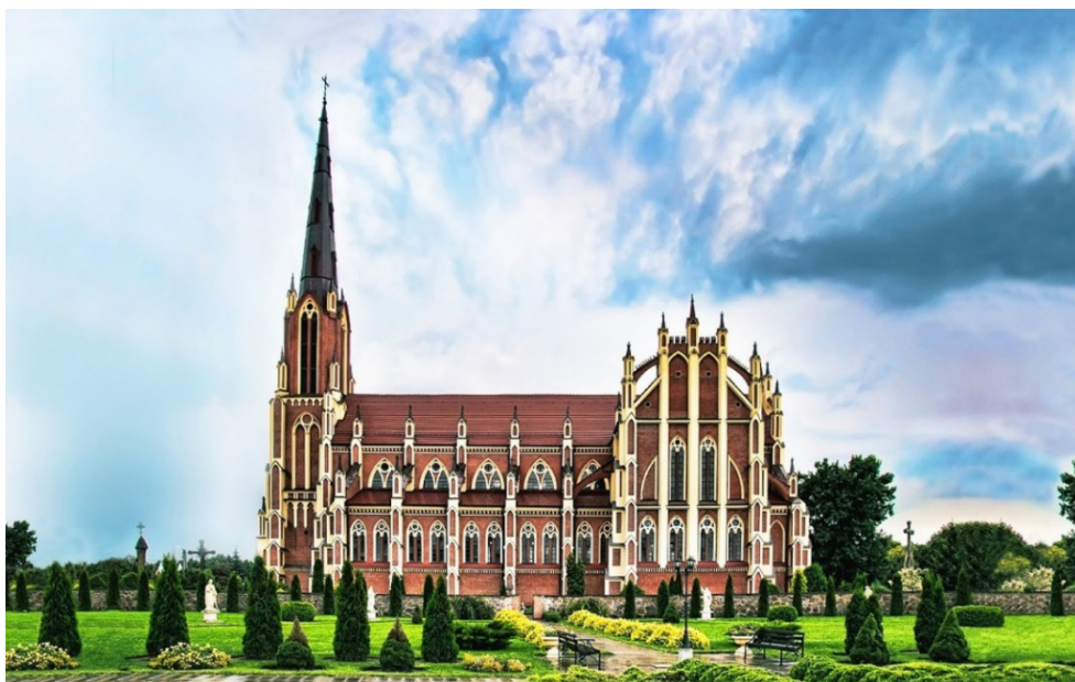
Мал. 6. Касцёл Найсвяцейшай Тройцы ў Гервятах

Уважліва паглядзіце на малюнку розных архітэктурных збудаванняў (малюнкi 6, 7, 8). Вызначце, якое іх прызначэнне? Ці звязана знешняя форма будынка і яго прызначэнне?