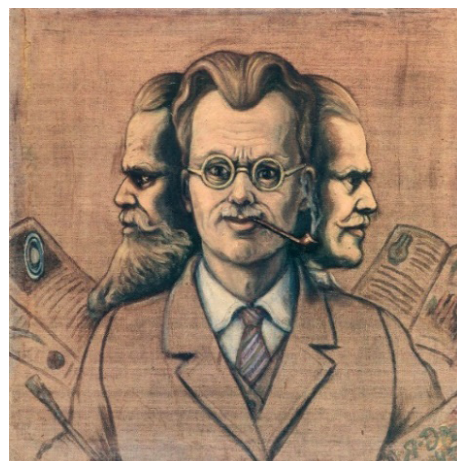
Мал. 4. Язэп Драздовіч «Аўтапартрэт» (1943)

Сярод талентаў больш і менш значных, больш і менш знакамітых ёсць імёны асаблівыя, азораныя яркасцю асобы мастака, драматызмам яго жыццёвага