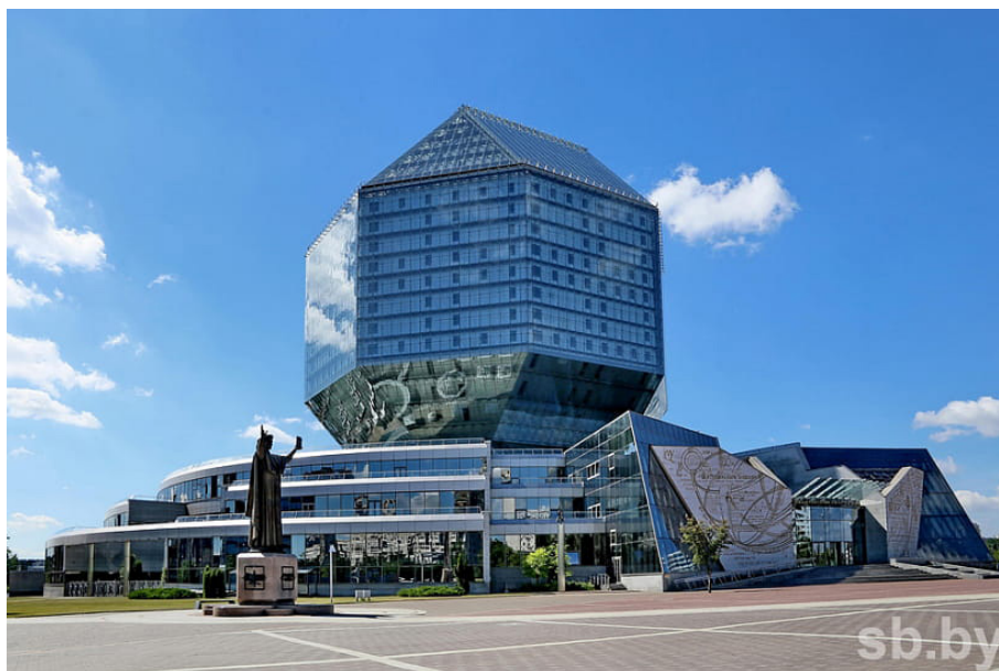
Мал. 8. Нацыянальная бібліятэка Беларусі