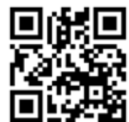
Мал. 2. QR-код для прагляду выступлення Т. Чарнігаўскай