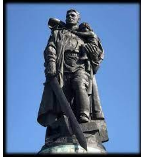
Памятник Воину- освободителю в Трептов-парке (г. Берлин)