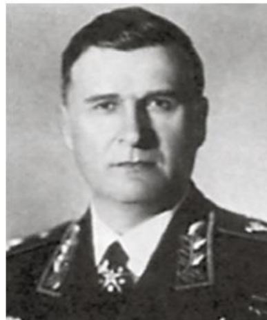
Василий Данилович Соколовский (1897—1968)

Маршал Советского Союза, Герой Советского Союза. На военной службе с 1918 г. Участник Гражданской войны. В Великую Отечественную войну начальник штаба Западного фронта, Западного направления, с февраля 1943 г. командующий Западным фронтом. С апреля 1944 г. начальник штаба 1-го Украинского фронта, с апреля 1945 г. заместитель командующего 1-м Белорусским фронтом.