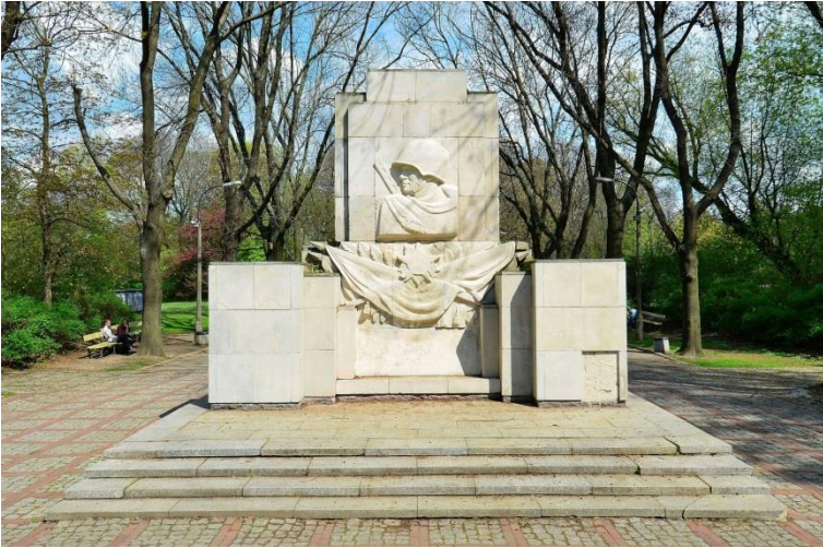
Памятник Благодарности Солдатам Красной Армии в Варшаве (уничтожен в 2018 г.)