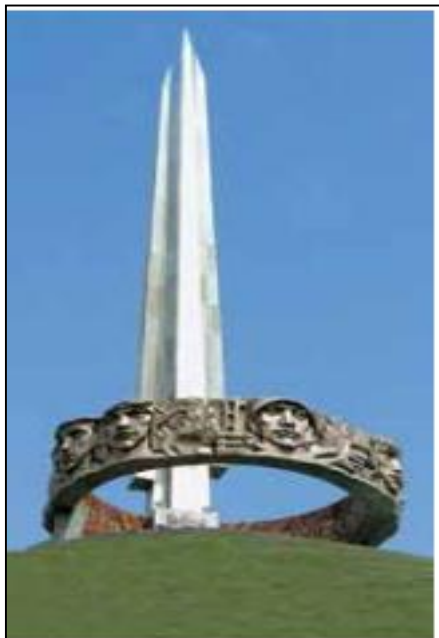
Курган Славы Советской Армии — освободительницы Беларуси.