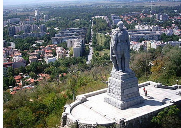
Памятник советскому воину- освободителю «Алеша» (г. Пловдив, Болгария)