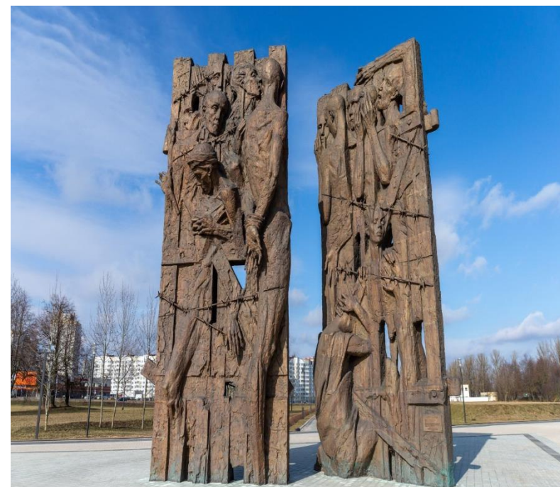
Мемориальный комплекс «Тростенец» в Минске с 10-метровым центральным монументом «Врата памяти»