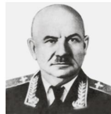
Степан Акимович Красовский (1897—1983)

Маршал авиации, Герой Советского Союза. Участник Гражданской и советско-финляндской войн. В Великую Отечественную войну на Южном, Брянском, Юго-Западном, Воронежском и 1-м Украинском фронтах: командующий ВВС 56-й армии, Брянского и Юго-Западного фронтов, 2-й и 17-й воздушными армиями. Участвовал в Сталинградской и Курской битвах, в освобождении Украины, Польши и других боевых операциях. Отличился умелым командованием авиацией и организацией ее взаимодействия с наземными войсками. После войны на руководящих постах в ВВС СССР.