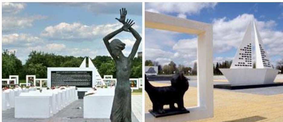
Мемориальный комплекс «Детям – жертвам войны» (Гомельская область, Жлобинский район, д. Красный Берег)