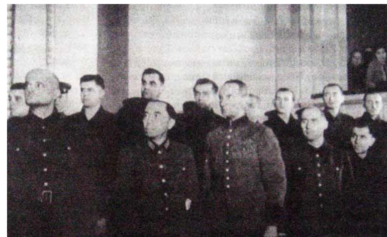
Обвиняемые немецкие военнопленные на судебном процессе.