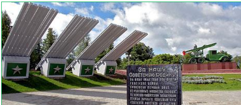
На берегу Днепра в Орше мемориальный комплекс "Катюша" ("За нашу советскую родину!")