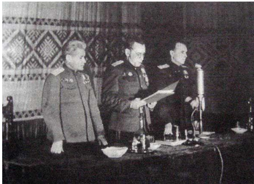
Зачитывание приговора по делу о злодеяниях, совершенных нацистскими оккупантами в Беларуси. 29 января 1946 г.

Процессы над лицами, совершавшими расправы над мирным населением в годы войны, проводились во всех случаях, когда был доказан факт злодеяния.