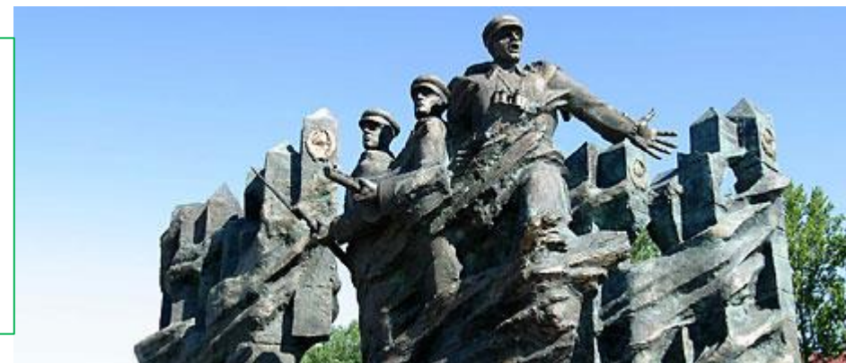
Мемориальный ансамбль в честь воинов Белорусского пограничного округа в Гродно