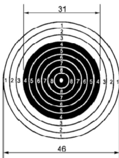
Мишень № 8. Размеры даны в мм

Мишень для выполнения упражнений стрельб из пневматической винтовки и (или) с использованием мультимедийного учебного тренажера (тира, оборудования для тира)