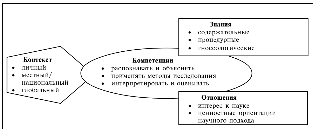
Рисунок 1. — Модель концептуальной рамки естественнонаучной грамотности [2]

Исследованием PISA определена концептуальная рамка естественнонаучной грамотности, включающая следующие компоненты: компетенции, контекст, знания и отношения (рисунк 1).