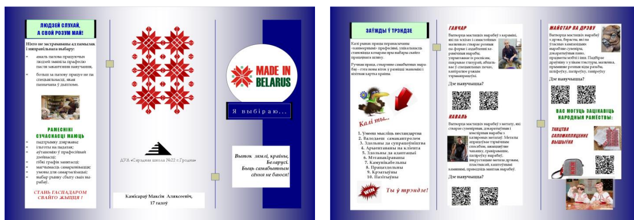
Рис. 7. Буклет « Made in Belarus »

Буклет « Made in Belarus » про традиционные белорусские профессии был разработан одним из участников проекта с целью популяризации традиционных ремесел Беларуси.