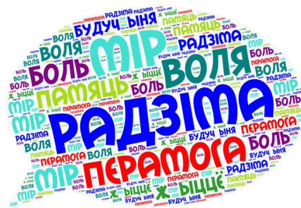
Малюнак 1. Воблака слоў

Вучням прапануецца саставіць водгук на інфармацыйную гадзіну ў форме калажа або воблака слоў.