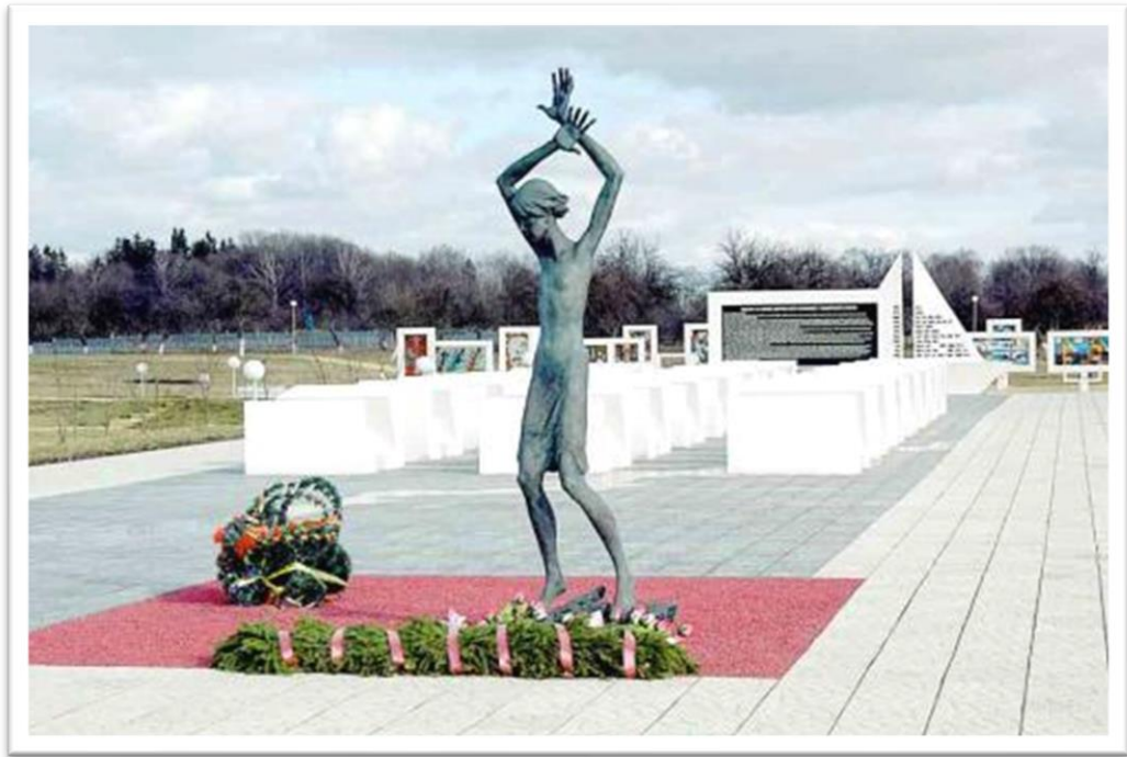
Фот.6. Мемарыяльны комплекс “Чырвоны Берэг”