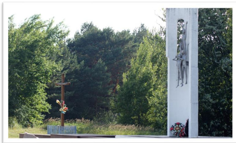
Фот. 4-5. Манумент “Пратэст”