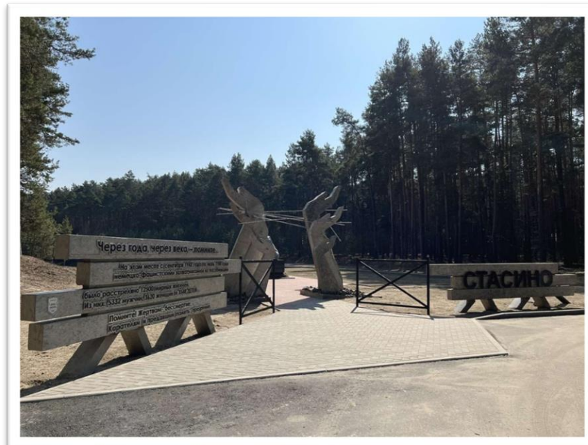
Фот.7. Мемарыял на месцы масавага пахавання ахвяр фашызму ва ўрочышчы “Стасіна”. Столінскі раён

На ўваходнай стэле мемарыяла высечаны словы: “Помните! Жертвам – бессмертие, карателям и предавшим память – презрение”.