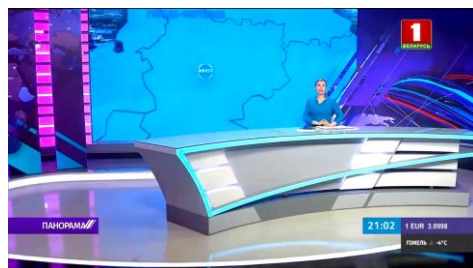
Видео «Застройка городов-спутников в Беларуси: что уже сделано?» (08:20)