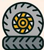
автошины и покрышки