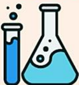
медицинские и жидкие отходы