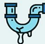
отходы текущего ремонта