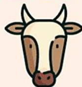
шкуры КРС и трупы животных