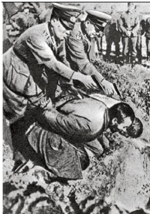
Установление «нового порядка»

«Новый порядок» — система военно-полицейских, экономических, политических и идеологических мероприятий, направленных на установление и поддержку государственного строя агрессоров, экономическое разграбление захваченных территорий; режим террора, издевательства над населением, насаждения национал-социалистической идеологии.