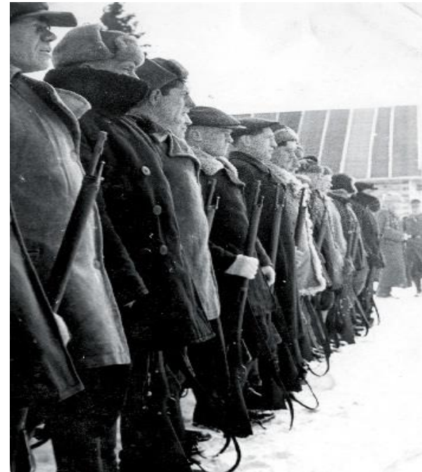
Бойцы Корпуса Белорусской Самообороны.

Коллаборационизм (фр. collaboration — «сотрудничество») — осознанное, добровольное и умышленное сотрудничество с врагом, в его интересах и в ущерб своему государству.