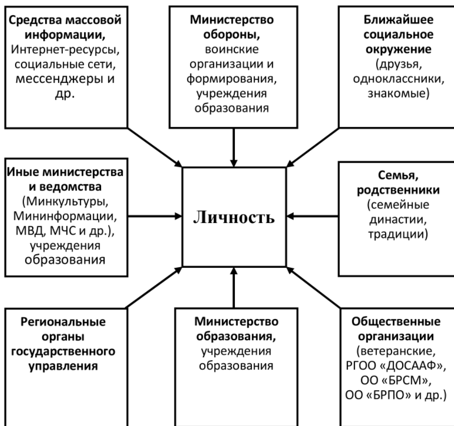
Рисунок 1. — Основные субъекты военно-патриотического воспитания

Одним из основных компонентов патриотического воспитания граждан является военно-патриотическое воспитание. Фундаментом его содержания выступает формирование и развитие у подрастающего поколения наиболее важных духовных и моральных качеств — любви к Родине, уважения законности и правопорядка, ответственности за осуществление конституционного долга и обязанности по защите Родины. Военно-патриотическое воспитание представляет собой целенаправленный управляемый процесс личностного развития граждан на основе гордости за боевую историю своей страны, формирования готовности к выполнению задач по обеспечению защиты Отечества и овладению необходимыми для этого знаниями, навыками и умениями.