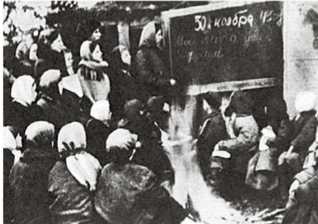
Лесная школа в партизанской зоне