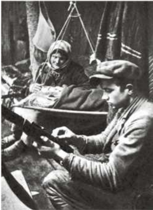
В партизанском семейном лагере

Успех борьбы против оккупантов во многом зависел от сотрудничества партизан и населения. Деятельность партизан поддерживалась большинством жителей.