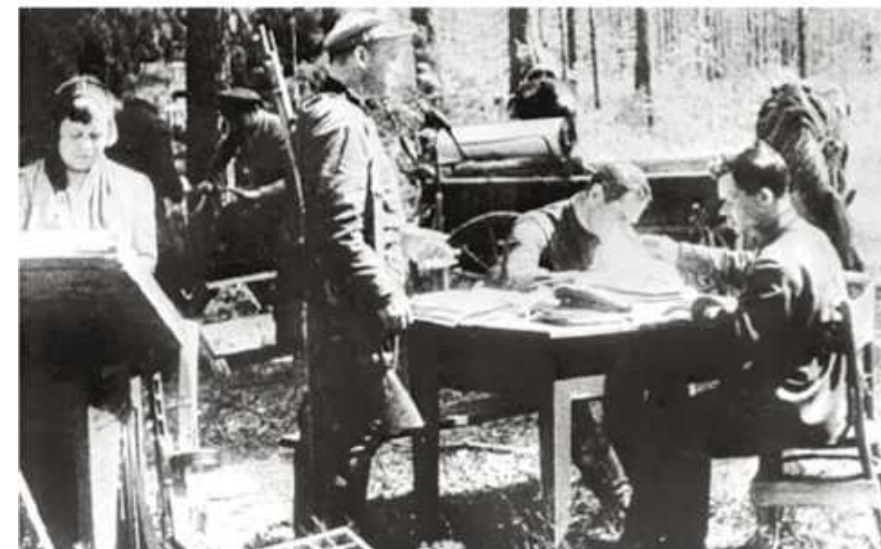
Типография в партизанском отряде. 1943 г.

беседы, собрания, митинги, выпуск и распространение подпольных газет, листовок, призывов.