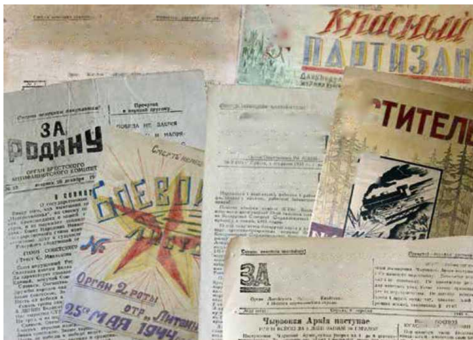
Подпольная и партизанская печать. Из фондов Белорусского государственного музея истории Великой Отечественной войны