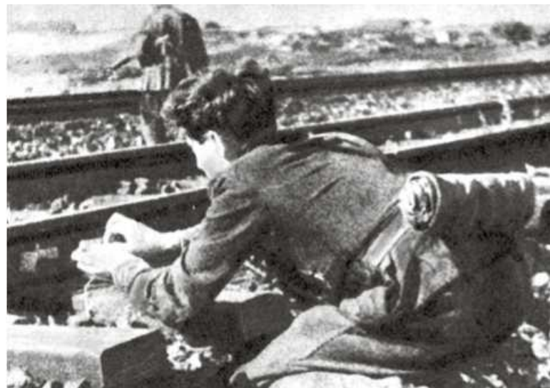
Партизаны готовят очередную диверсию на железной дороге

Главными направлениями деятельности белорусских партизан были: