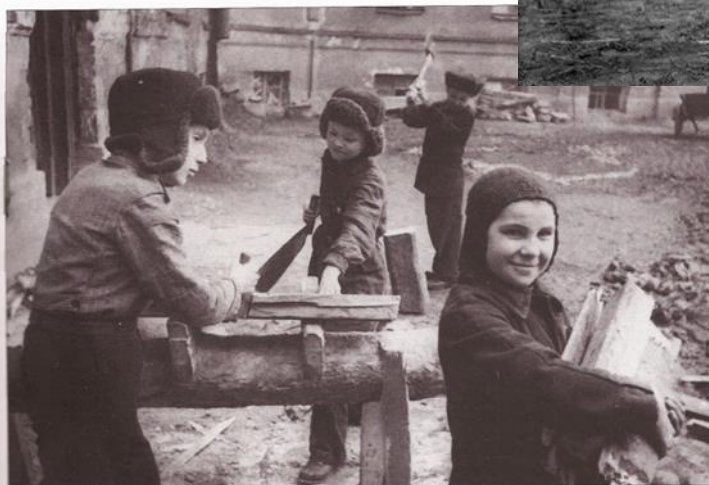
Ребята-тимуровцы за работой. [1941–1944 гг.], Ленинград.