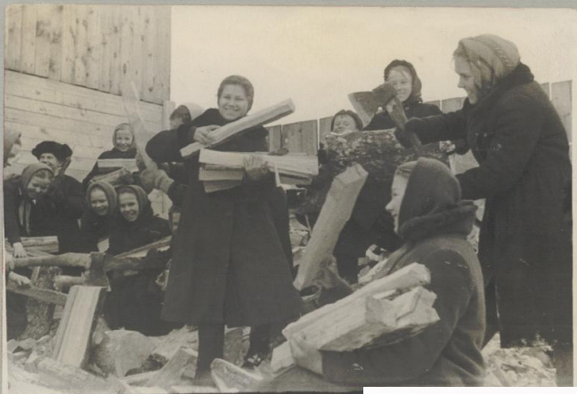
Лучшая тимуровская команда средней школы № 5 за работу Ф 6728