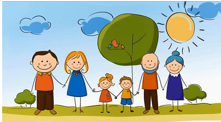
Семья. Там, где живет счастье!

ДОБРОТА . Желание помочь слабому, незащищенному, оказать поддержку, потребность быть полезным. Такие отношения делают семью гармоничной.