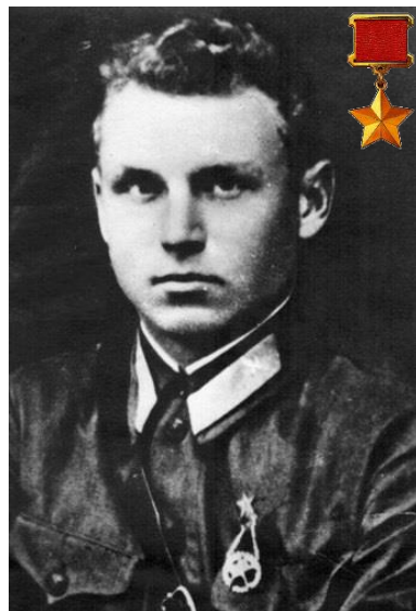
Александр Константинович Горовец

Войсковыми соединениями командовали 217 генералов и адмиралов — белорусов.