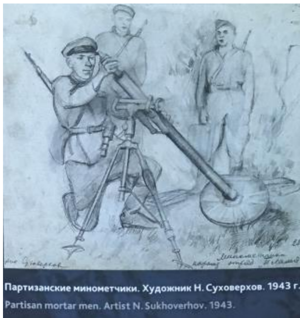
Партизанские минометчики. Художник Н. Суховерхов. 1943 г. Partisan mortar men. Artist N. Sukhoverhov. 1943.

13) варианты участия в советском партизанском движении на территории Беларуси представителей иностранных государств – т.н. зарубежных антифашистов: в пример приведены перебежчики из немецких оккупационных войск – немецкие солдаты и офицеры разных национальностей, перешедшие к