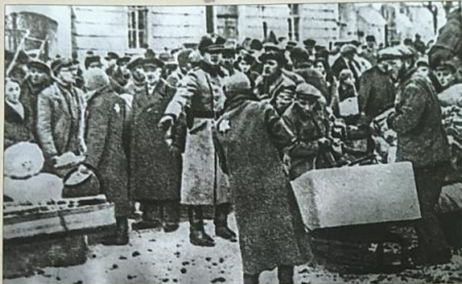
Переселение евреев г. Гродно в гетто. 1941 г. Resettlement of Grodno Jews to ghetto. 1941.

Что касается уникальности антинацистского сопротивления на территории Беларуси в 1941 – 1944 гг., то основное содержание энциклопедии посвящено именно советскому партизанскому движению. Другие варианты антинацистского сопротивления оставлены за кадром сознательно, поскольку могут стать темой отдельной большой работы. Кроме того, проведение сравнительного анализа деятельности партизан разной политической направленности не являлось целью при подготовке энциклопедии.