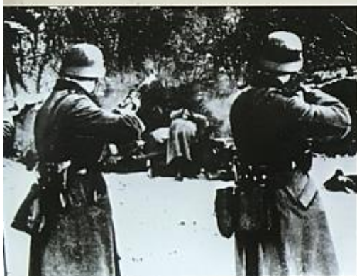
Расстрел советских партизан командой СС. 1941 г. The SS unit shoots Soviet partisans. 1941.