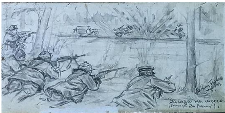
Партизанская засада на шоссе. Художник Л. Бойко. 1943 г. Partisan ambush on the road. Artist L. Boiko. 1943.