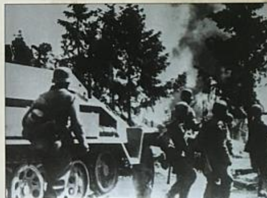
Гитлеровцы поджигают населенный пункт. 1941 г. The Nazi set a town on fire. 1941.

Советское партизанское движение было самым массовым движением сопротивления во всей оккупированной нацистами Европе, а также самым результативным.